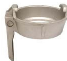
MKH Anello di chiusura con leve