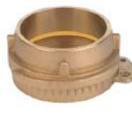
VK Raccordo Rapido maschio filettato femmina