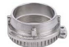
VK Male female threaded quick coupling