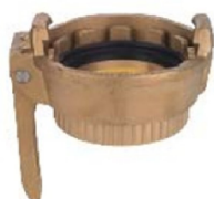
MK Raccordo Rapido femmina filettato femmina con leva

Sono dei prodotti molto duttili e vengono utilizzati per una vastità di applicazioni che variano dal settore chimico, petrolifero, farmaceutico comprendendo anche le industrie cartarie, cementiere e siderurgiche.