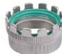
MKH Locking ring with levers