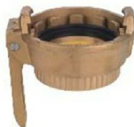
MK Quick Connector female threaded female with lever

They are very ductile products and are used for a vast variety of applications ranging from the chemical sector, oil, pharmaceutical, including the paper, cement and steel industries