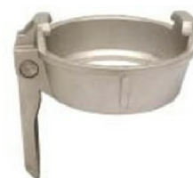
MKH Locking ring with levers