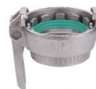
MK Raccordo Rapido femmina filettato femmina con leva