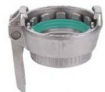
MK Quick Connector female threaded female with lever