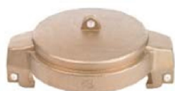
MB Tappo femmina