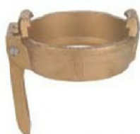
MKH Locking ring with levers