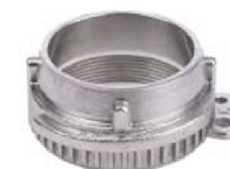
VK Raccordo Rapido maschio filettato femmina