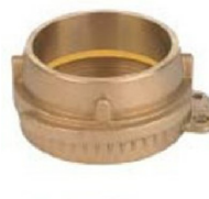
VK Male female threaded quick coupling