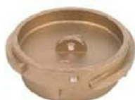
VB Male Cap