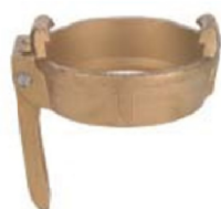
MKH Anello di chiusura con leve