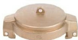
MB Female Cap