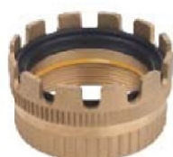
MKH Anello di chiusura con leve