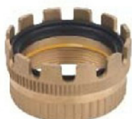
MKH Locking ring with levers