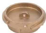
VB Tappo maschio