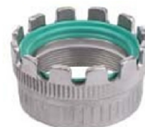
MKH Anello di chiusura con leve